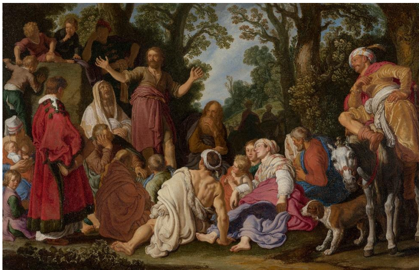
De prediking van Johannes de Doper. Lucas 3 vers 3 Schilderij van Pieter Lastman